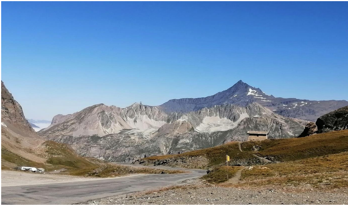
Bourg saint Maurice ; passé Bonneval les Bains, sur la D902, au bord du Torrent des glaciers, nous mettons pied à terre pour pique-niquer.